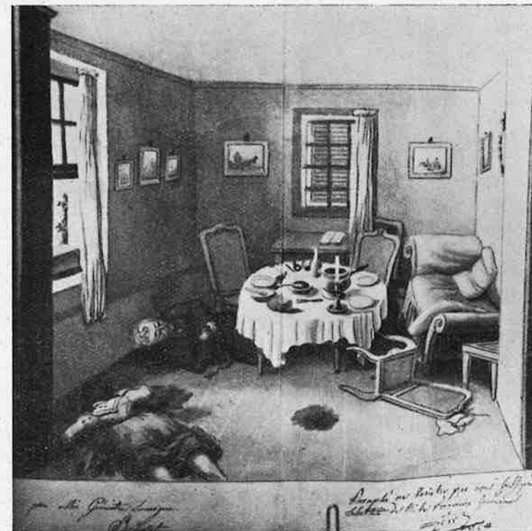
Fac simili de l'aquarelle Burdallet, Assassinat de M. C. et sa servante, à Plainpalais, en 1820. (Cliché Vatré).

Reconnus coupables avec préméditation, ils furent condamnés à mort et guillotинés à la Place Neuve, le 9 mars 1821, à 10 heures